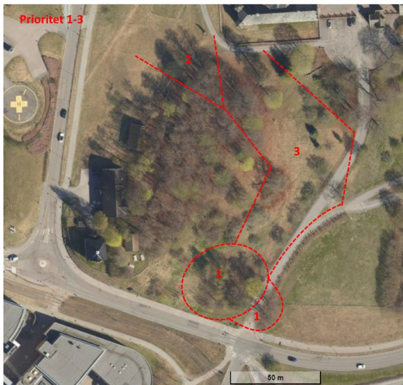
Figur 1. Områder undersøkt for fuglehekkning. Hovedkartlegging ble utført 19. juni 2024. Nummer tilsvarer prioriteringsrekkefølge for felling av trær.

Aksjonistene var sterkt imot slåing av eng på grunn av hekkende fugler og nyfødte dyreunger i området. Ulike aktører hadde sendt merknader og klager til PBE og 20. juni sendte PBE brev til Multiconsult, som er ansvarlig søker på vegne av HSØ, der de bad om en uttalelse om felling av trær i hekketiden . 20 og 21 juni fikk PBE svar som inneholdt et notat om hekkende fugl organisert etter tre områder i den aktuelle teigen. I tillegg mottok de en e-post som gjaldt et fjerde område.